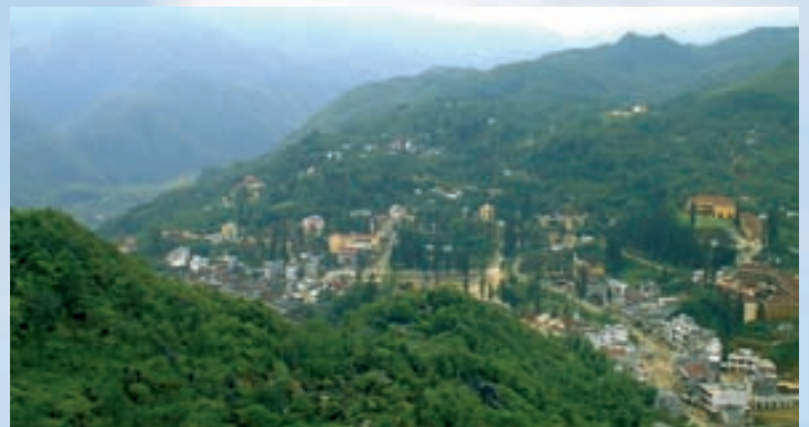
▲ Sa Pa